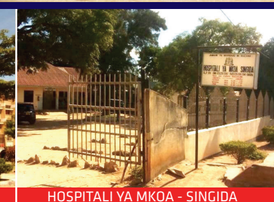
HOSPITALI YA MKOA - SINGIDA

“Iwani Watakatifu Katika Mwenendo Wenu Wote. Kwa Kuwa Mimi Ni Mtakatifu” (1 Petro 1:15-16).