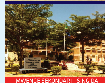
MWENGE SEKONDARI - SINGIDA